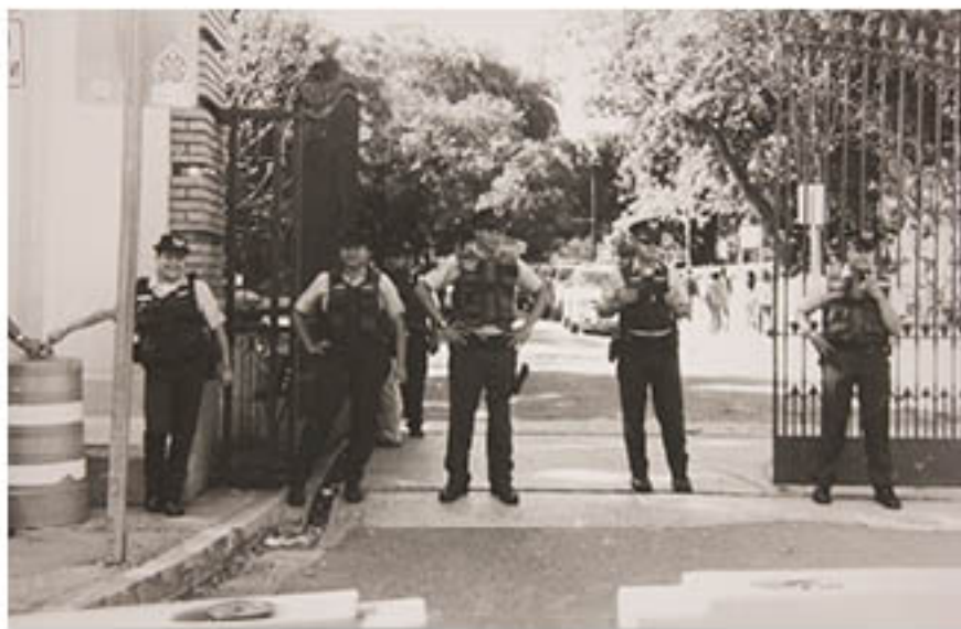
ARNALDO COTTO REYES (Puerto Rico) Untitled (from series) , 2010 Gelatin silver print, 20" x 45" x 1/2" (9" x 6" x 1/2" ea.)